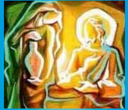
II DI QUARESIMA "DELLA SAMARITANA"

L a Samaritana ha incontrato Gesù e gustato l'acqua viva del suo amore. Senza aver cercato consapevolmente questi beni, è stata prevenuta dall'iniziativa salvifica del Signore, ha trovato quindi il più grande di tutti i tesori senza aver fatto gran che per meritarlo, anzi, avendo fatto molto per rischiare di perderlo, ma da adesso in poi, da quando ha gustato l'acqua viva, sostenuta dalla grazia dell'incontro con il suo Signore, dovrà imparare a cercare consapevolmente l'amore di Dio come il più prezioso di tutti i beni, il più prezioso di tutti gli amori.